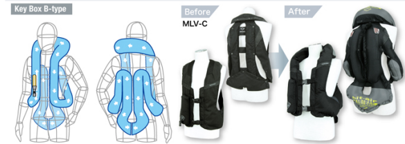
Model : MLV-C, MLV-RC, MLV-P, SKV (for Kids), MLV-YC

Wearable over an ordinary jacket or a raincoat. Designed to minimize contact area with the jacket. Adjust the size using a waist adjuster. Wearable as a protector in any season.