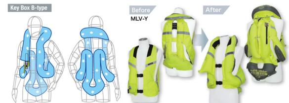
Model : MLV, MLV-R, MLV-Y