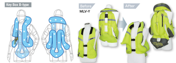
Model : MLV, MLV-R, MLV-Y